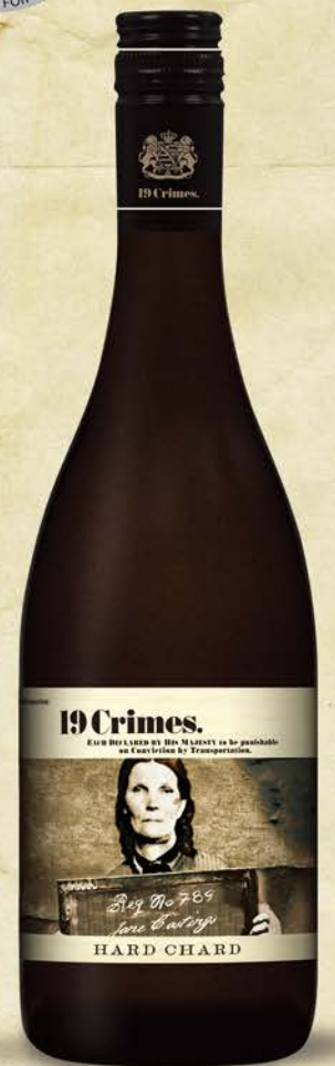
19 Crimes Hard Chardonnay