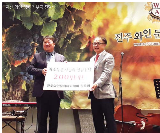
자선 와인 경매 기부금 전달식