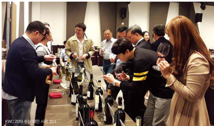
KWC 2019 수상 와인 시음 코너